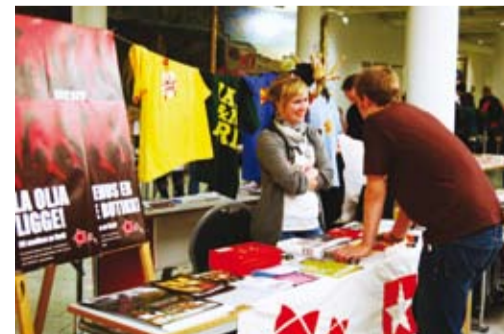
Fra standen på Globaliseringskonferansen

Det ble arrangert møter om alt fra biodrivstoff til Kaukasus. Spesielt stormøtene var populære, og ordvekslingen gikk hardt for seg da Jonas Gahr Støre stilte til debatt om Norges krigføring i Afghanistan. Rød Ungdom arrangerte et møte om sosialistisk folkestyre med over hundre deltakere, i tillegg til bøllekurs og møter om femisme.