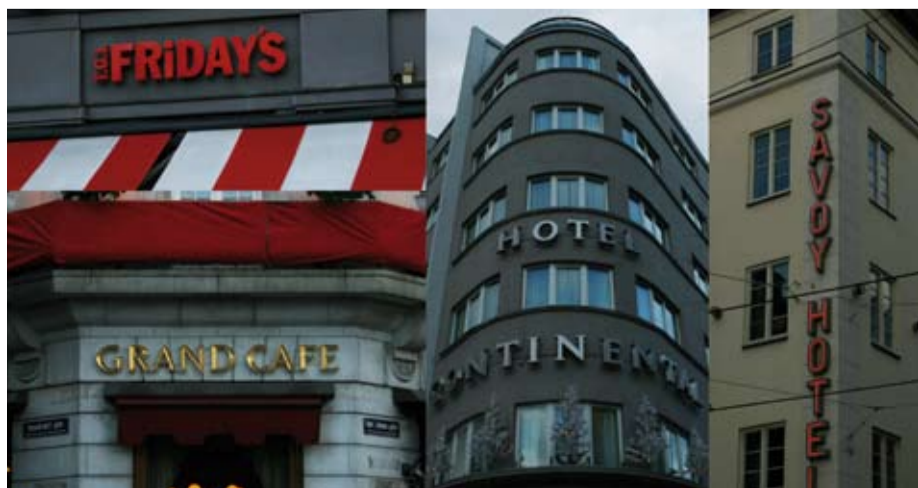
Kva er framtida for dei som skal jobbe her? (Illustrasjonsfoto)