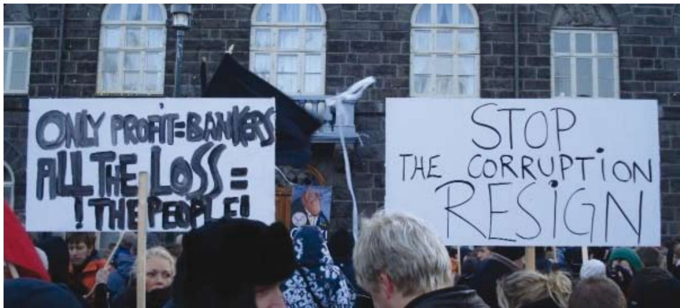
«Bankene tar bare profitten – folket må bære tapan!» «Stopp korrupsjonen – gå av!» Fra en demonstrasjon (mótæli) på Island 15. november i år.