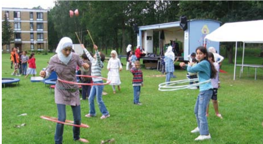
Barn skal leike og trives, ikke lønne seg. (Illustrasjonsfoto)

søke å gjøre alt til varer. Nå er avfall blitt en vare: Brukt plast og ødelagte kjøleskap reiser verden rundt med fly og båt, fordi det er solgt på børsen. Det skal kanskje til gjenvinning, men hvordan blir miljøregnskapet? Det har ikke den enkelte avfallselger ansvaret for. Kapitalismen er anarkistisk. En må forstå hvordan kapitalismen fungerer for å forstå sosialismen.