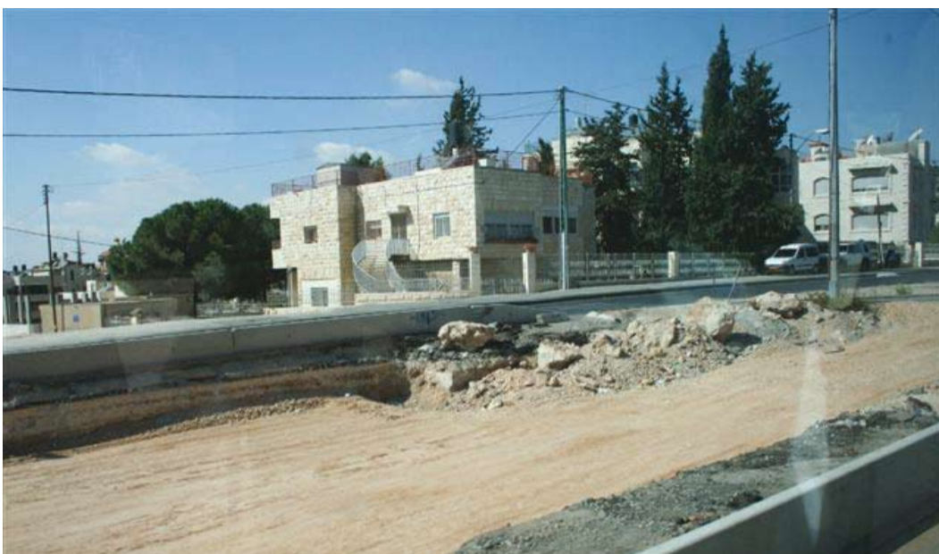
Banen går tvers gjennom palestinske bydeler.

Rødt i Oslo ved bystyreprerentant Erling Folkvord har levert forslag om at Oslo kommune ikke skal gjøre avtaler med selskapet Veolia, fordi det bygger jernbane (bybane) på palestinsk land som Israel har okkupert.