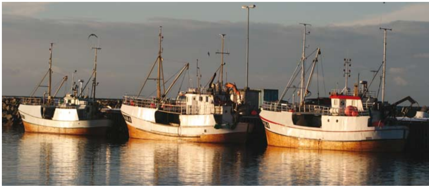
Sameretten er til gunst for alle som bur langs kysten.

eigne lover, bygde på rettspraksis og allmenne rettar, som til dømes at dei skal få bruke språket sitt i alle samanhengar. I dag er sørsamisk på lista til Unesco over utryddingstruga språk, og samisk elles er under press. Det er ei ulukke om desse språka blir borte.