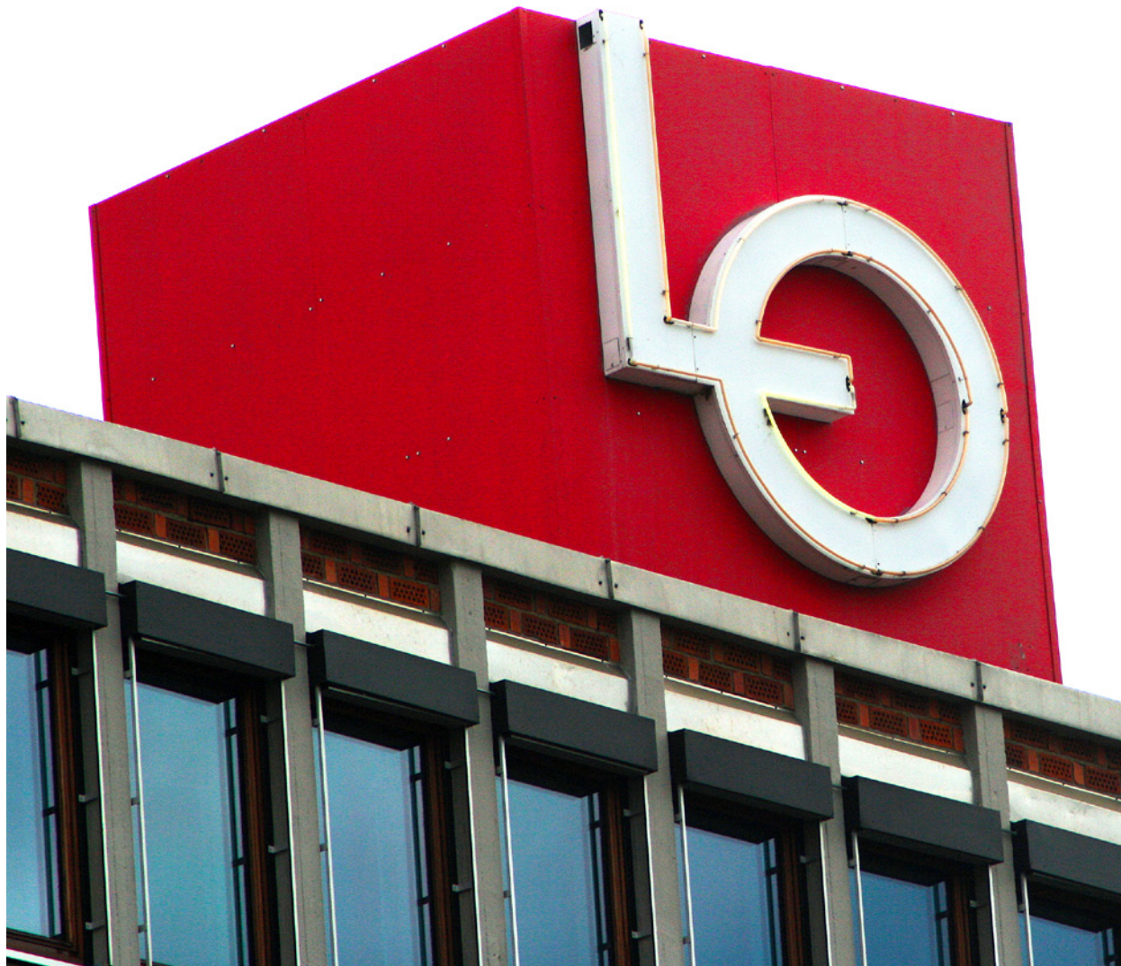
Utfordringer: Norsk fagbevegelse står overfor store utfordringer i 2012.

– Adecco-saken viser at det er kommunene som bør ha hovedansvaret for omsorgen overfor egne innbyggere. Dette gjelder ikke bare for sjukehem, men også andre velferdstjenester. Ved kommunal drift forsvinner behovet for profittmaksimering og en får et bedre grunnlag for ryddige forhold. Gode velferdstilbud koster, og derfor mener vi at statens overføringer til kommunene må styrkes. Vi må kunne bruke penger på det som er viktig i livet, som folks velferd. Både i arbeidslivet og for de som trenger pleie, må livskvalitet og verdighet veie tyngre enn kroner og øre.