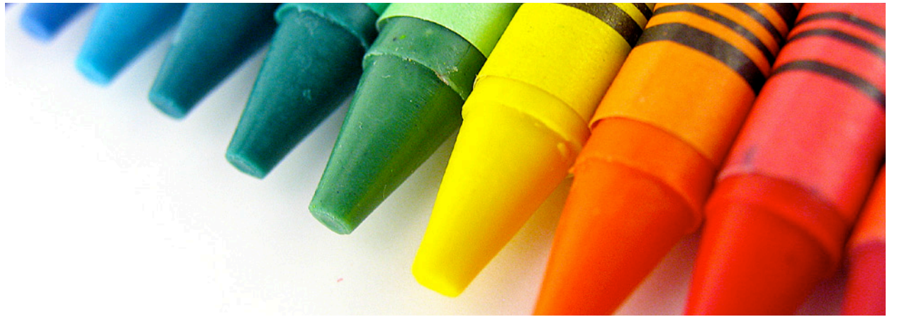
Barnehage: Kontantstøtten står i veien for full barnehagedekning.