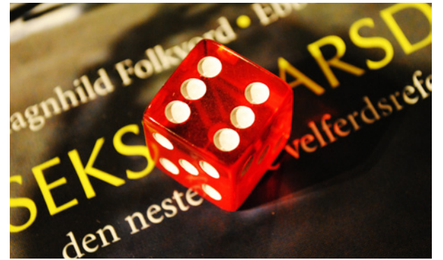
Sekstimersdag: Et offensivt krav for styrking av velferdsstaten.

– Sekstimersdagen vil gi et mer anstendig arbeidsliv og et bedre liv for de ansatte, samtidig som det vil gi bedre kvalitet på omsorgen, avslutter bystyreprerentanten.