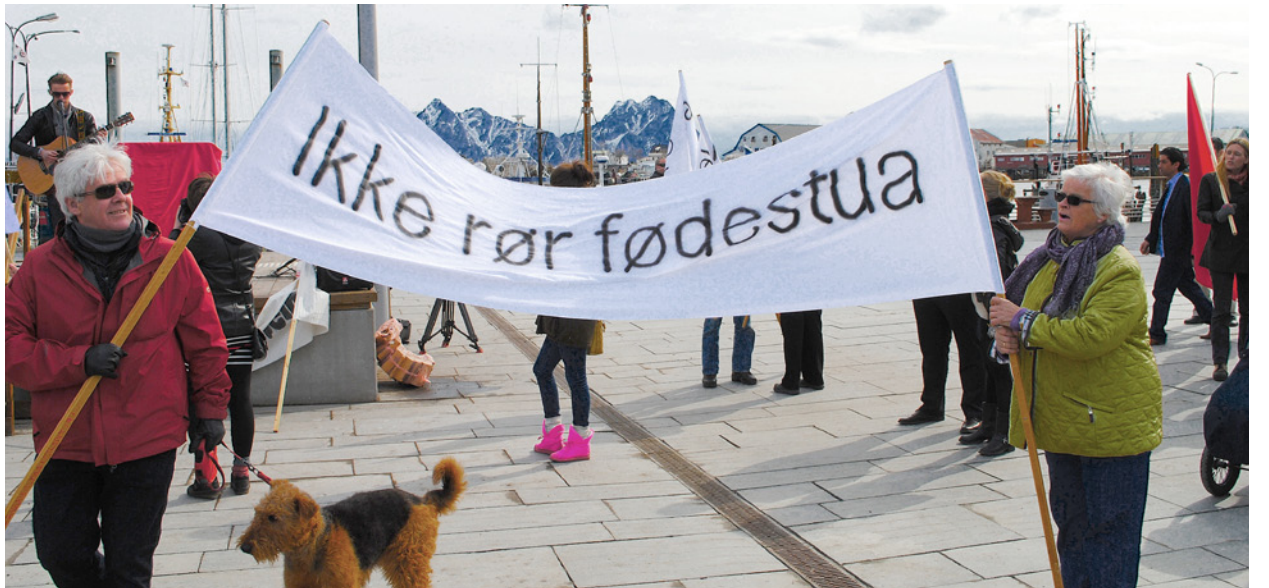
Ikke rør fødestua: Mange kommuner rammes av sentraliseringa i helsevesenet. Her fra Svolvær i Lofoten.

– Vi mener at ordninga i dag er god, men vi ser at den har et kapasitetsproblem. Vi mener at alle som skal melde seg opp til norsk turnustjeneste skal være motivert og satt inn i hvordan det norske systemet fungerer. Det er viktig å sikre at de som melder seg opp til turnustjenesten faktisk tilfredsstillende disse kravene. Derfor mener vi at man må innføre en fagprøve som skal teste alle studenter i samfunnsmedisin, trygdemedisin, sosialmedisin og organisering av helsetjenester i Norge. Fagprøven skal være gjennomført før oppmelding. Vi ønsker også å innføre depositum før oppmelding, stramme inn språkkravene til alle som melder seg opp og styrke Statens Autorisasjonskontor for Helsepersonell for å sikre god organisering av tjenesten, avslutter Lupton.