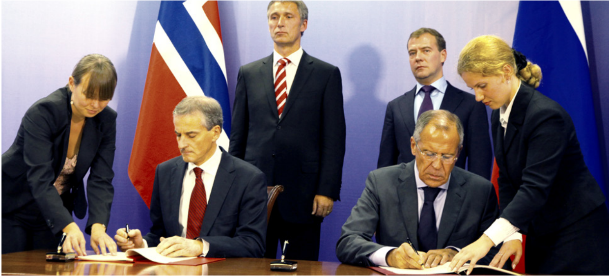
Kappløp: Delelinjeavtalen mellom Norge og Russland har skapt enorme forventninger til oljevirsomhet i Barentshavet.