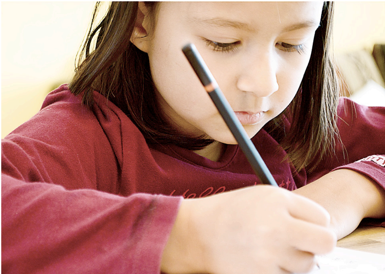
Blir rangert: Høyre innfører karakterer i 7. klasse i Osloskolen.