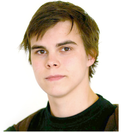
Faglig ansvarlig: Audun Ulvsønn Nyheim.

– Dette er et utrolig flott initiativ fra Utdanningsforbundet. Kanskje det kan hjelpe Ødegaard til å forstå at Osloskolen ikke er til for rangering, men for læring, avslutter Øgrim.