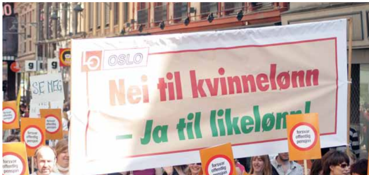
Kvinner har gått i tog for høyere lønn i kvinnedominerte yrker i mange år. Her fra første mai i Oslo 2009