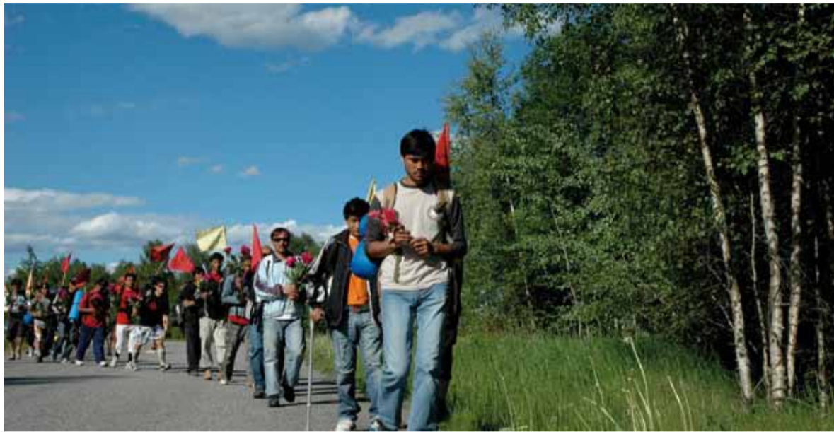
Afgghanske flyktninger gikk fra Trondheim til Oslo i 2007 for å fortelle om sin sak. Mange unge flyktninger er afghanere.

Nå kan myndighetene få undersøkt kjønnsorganene og tarmene til enslige ungdommer som søker asyl i Norge, hvis de er i tvil om ungdommene er under atten år.