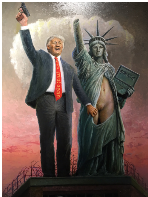
Maleri av Rolf Groven 2017 «Trump» Foto: Gerd Inger Polden

har vært nok prat om #metoo nå. Det er å be kvinner holde kjeft og godta den uretten vi blir utsatt for. Men vi er ikke ferdigsnakka før problemet er borte. De som blir utsatt for seksuell trakassering skal ikke stå alene. Er det én ting #metoo har lært oss, så er det at vi står sterkere sammen».