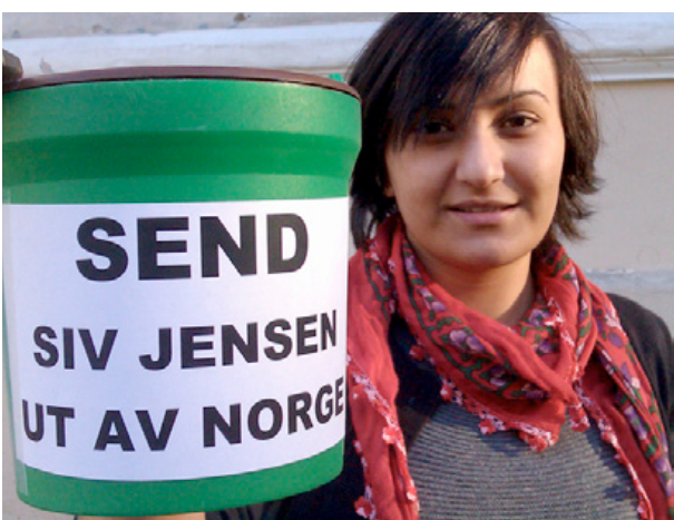
Generalsekretær: Seher Aydar.