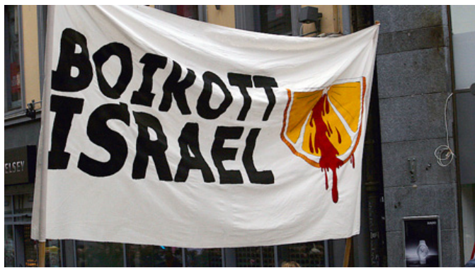
Boikott: En enkel solidaritetshandling.

Også når man handler inn til julemiddagen bør man være oppmerksom. Nicola nypoteter og gulrøtter fra Gartner/Bama er blant de israelske grønnsakene som er