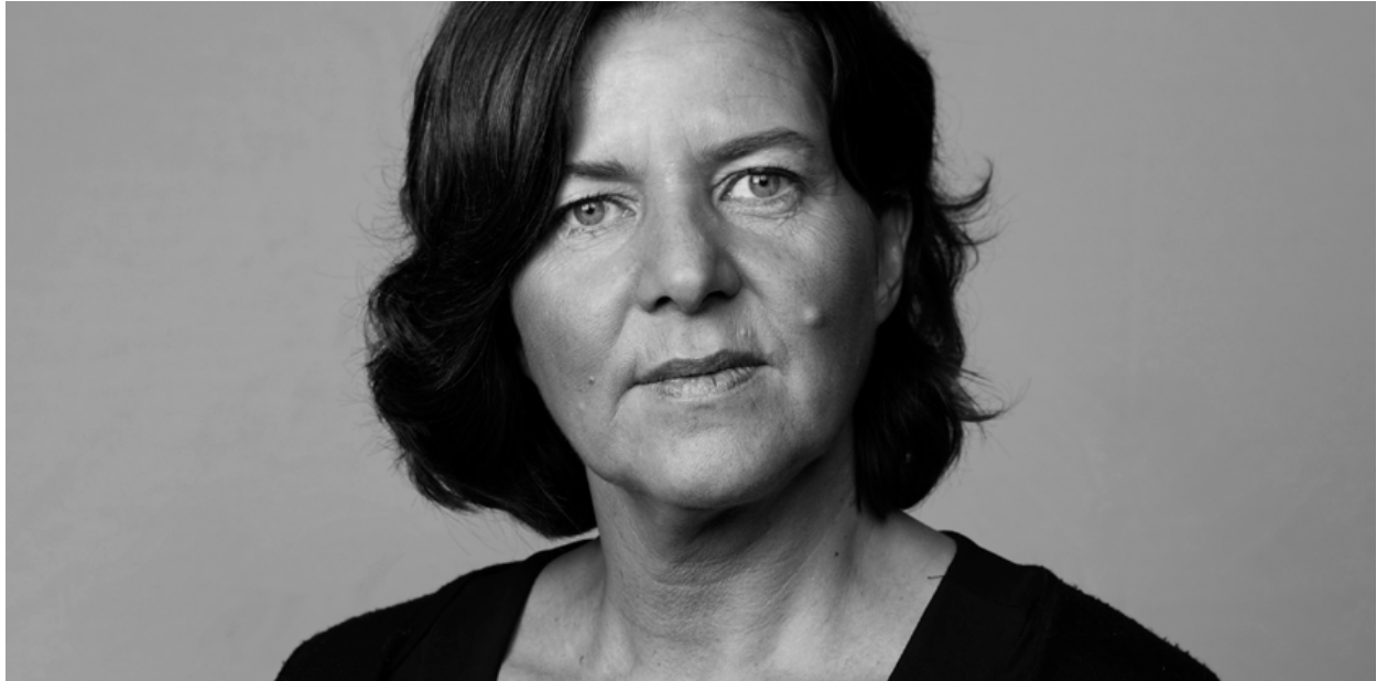
Arbeidsminister: Hanne Bjurstrøm vil kutte dagpenger for eldre arbeidsløse.