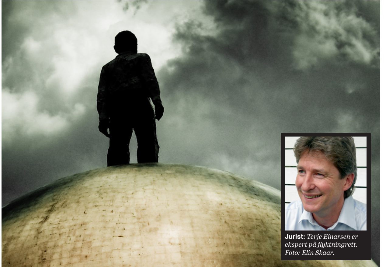
Rettsløse: Mange flyktninger som kommer til Norge opplever ikke den rettssikkerheten de har krav på.

Les mer om kampanjen på www.robinhoodskatt.no .