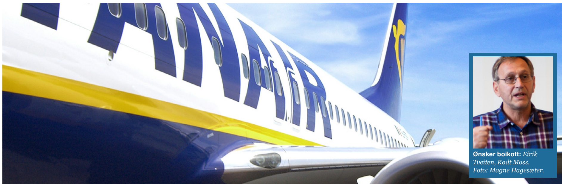
Ryanair: Billige flybilletter betales med sosial dumping.

Ønsker boikott: Eirik Tveiten, Rødt Moss.