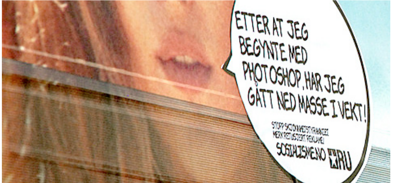
Aksjon: Rød Ungdom tar saken i egne hender og merker kvinnefiendtlig reklame.