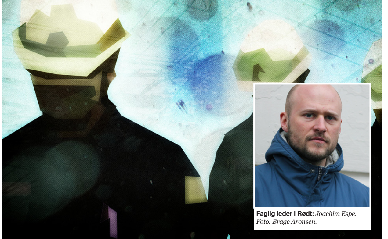
Faglig leder i Rødt: Joachim Espe. Foto: Brage Aronsen.

Nye regler: Nye regler om permitteringer vil føre til arbeidsløshet og midlertidighet. Illustrasjon: Ssoosay/CC.