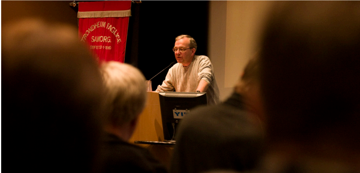
Trondheim: Rød Ungdom peker på Trondheimskonferansen som et viktig forum for venstreopposisjonen i LO.