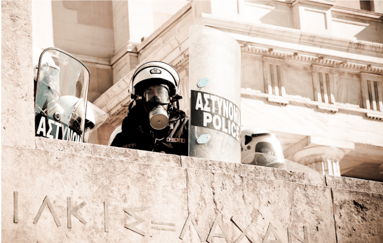
KRISE: Hellas er hardt rammet av den økonomiske krisa. Her fra en generalstreik i 2011.