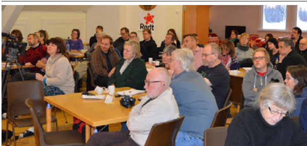
Mesnali: Rundt 70 deltakere samlet seg i januar for å diskutere sosialisme.