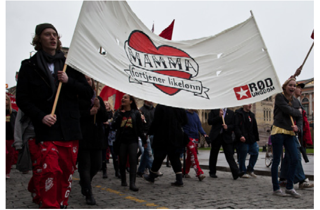
Faglig kamp: RU 1. mai 2010.

Og med det slår Øhn Mehlen fast at hun gleder seg til årets Trondheimskonferanse.