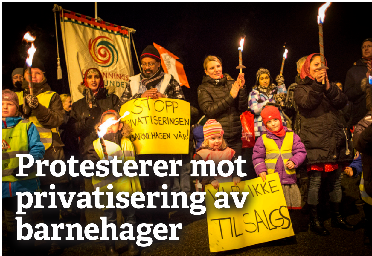
Foreldreaksjon: Fra demonstrasjonen mot konkurranseutsetting før jul.

Seminaret går av stabelen på Litteraturhuset i Oslo 1. mars. For mer informasjon og påmelding, se www.sekstimersdagen.no