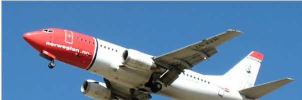
Møter motbør: Flyselskapet Norwegian.