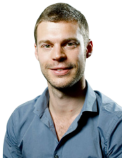
Bjørnar Moxnes b.moxnes@roedt.no Leder i Rødt