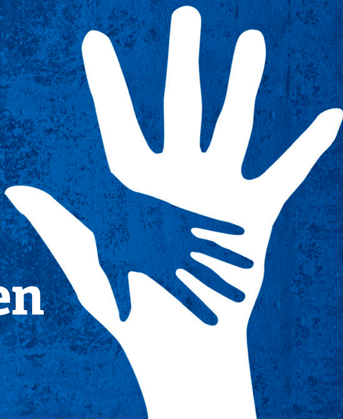
Illustrasjon: Ole Mjelstad