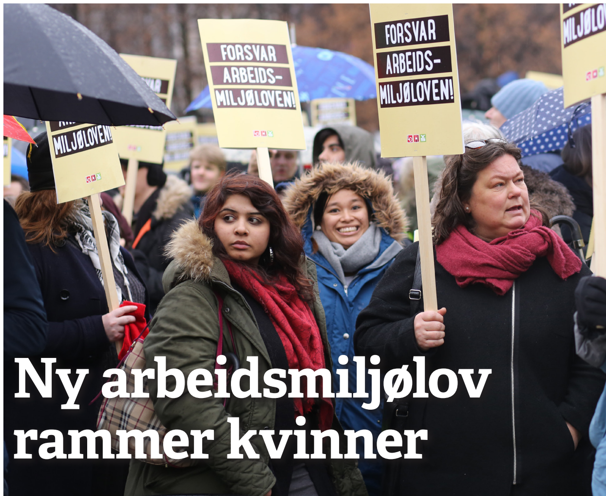
Motstand: Regjeringas forslag til ny arbeidsmiljølov møter motbør. Her fra den politiske streiken 28. januar.

Problemet kunne vært løst med et regulert boligmarked, økt barnetrygd og overgangsstønad, likelønn, mindre midlertidige stillinger og økt engasjement for kvinner på bunnen av klassehierarkiet. Den voksende fattigdommen blant alenemødre er en klassebasert og patriarkalsk undertrykking av vanskeligstilte kvinner.