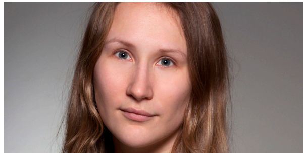
Forfatter: Oda Faremo Lindholm.

– På grunn av den enorme tilgangen til media fra ung alder, plukker små barn også tidligere opp