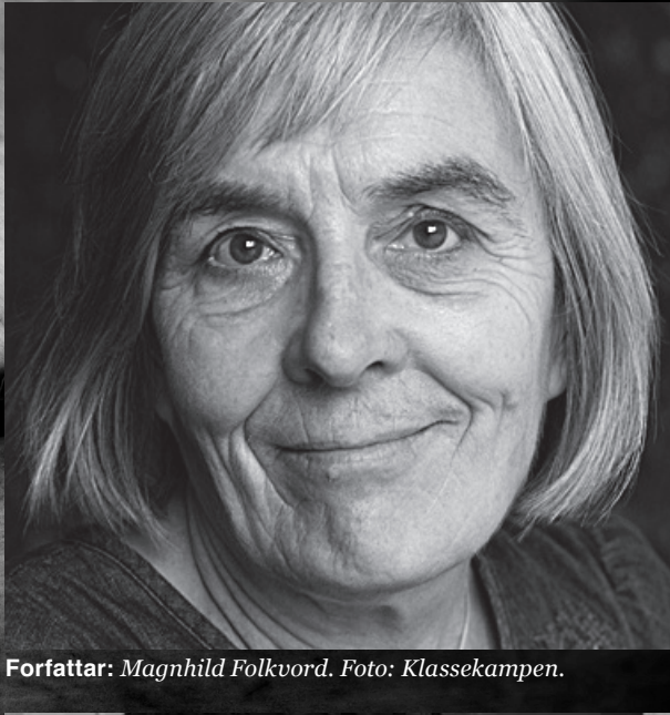
Forfatter: Magnhild Folkvord.

– Ein kan ikkje venta at kortare normalarbeidsdag skal føra til lågare sjukefråvær. Kjem det ein influensaepidemi, blir folk sjuke anten dei jobbar tre eller åtte timar om dagen. Men forsøk har vist at mange har kjent seg friskare, sove betre osv med sekstimarsdag. Sekstimarsdagen må ha vart lenge før ein kan venta eventuell påverknad på sjukefråværet, seier ho.