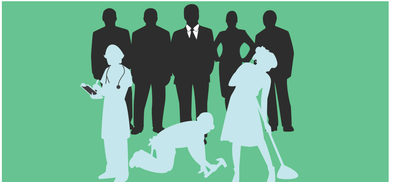
Norge 2015: Nytt hefte i sal no. Illustrasjon: Ole Mjelstad.