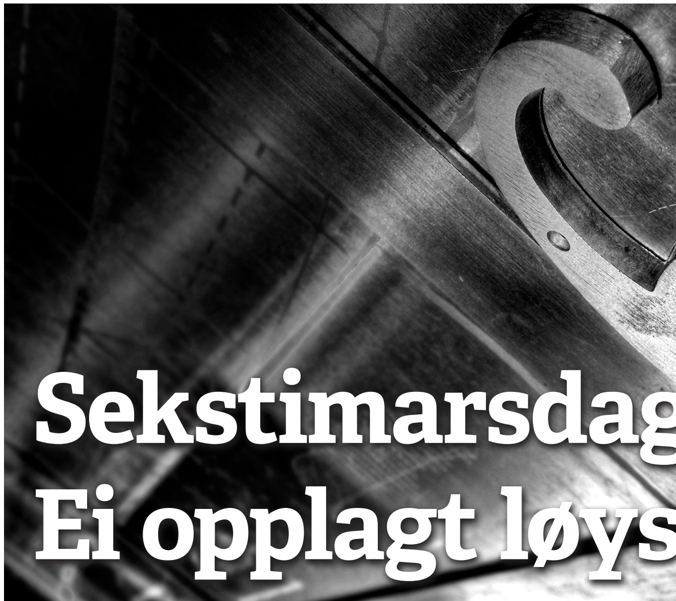
Børster støv av sekstimarsdagen: Kortare arbeidsdag kan sørge for heile stillingar i mange yrker.