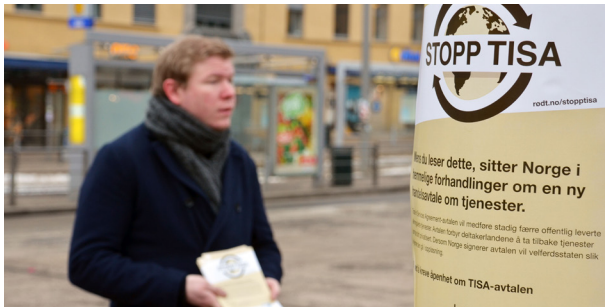
Aksjon: Fra Rødts aksjonsdag mot TISA.