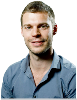
Bjørnar Moxnes b.moxnes@roedt.no Leder i Rødt