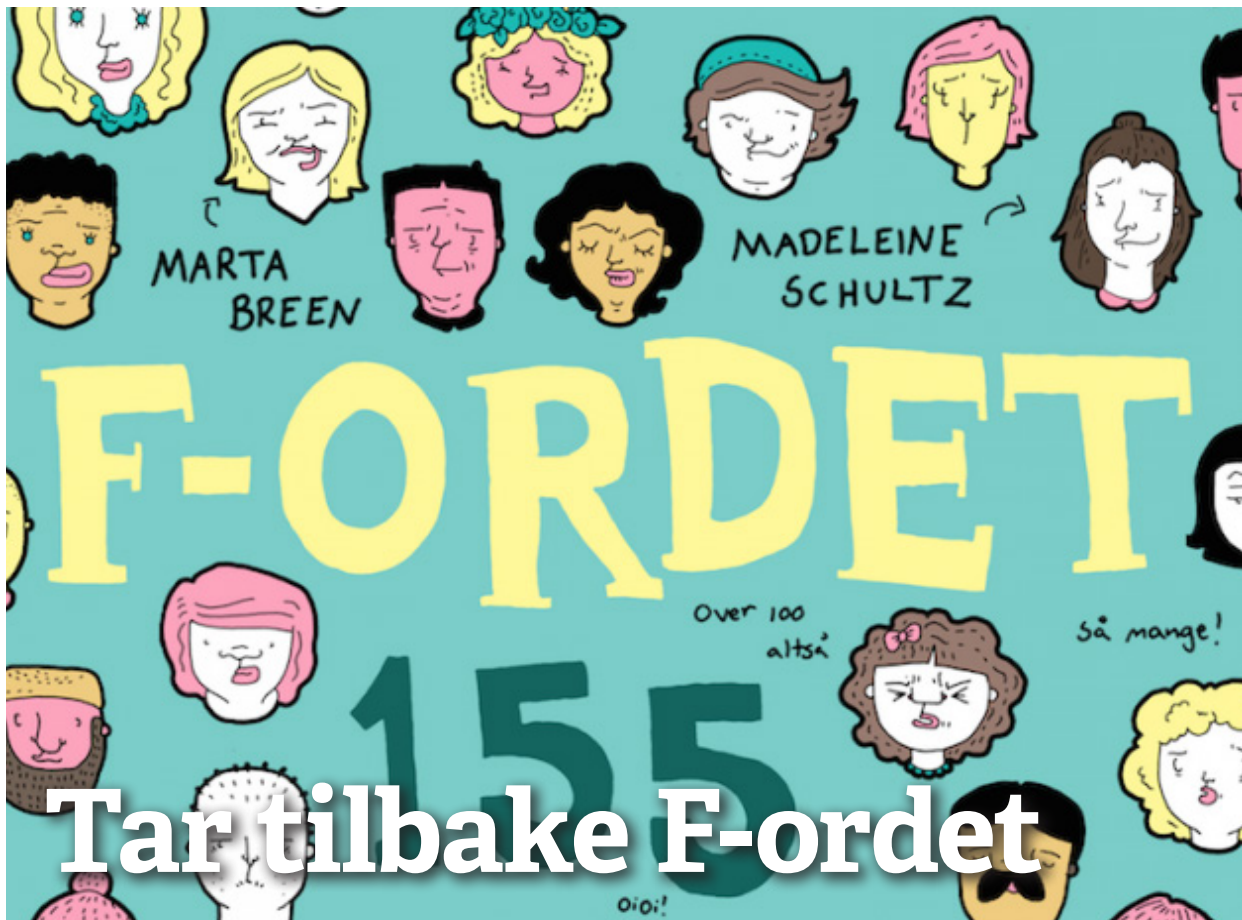
F-ordet: Jenny Jordahl har illustrert boka som snart kommer på Manifest forlag. Illustrasjon: Jenny Jordahl.