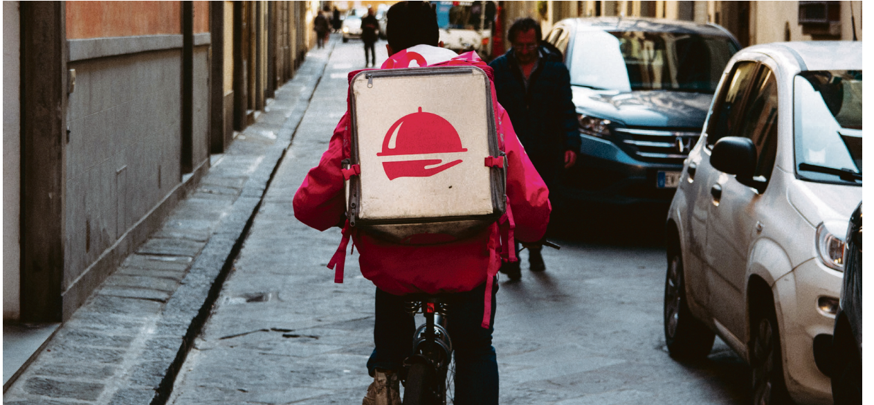
I streik: Foodora-syklisterne i Oslo.