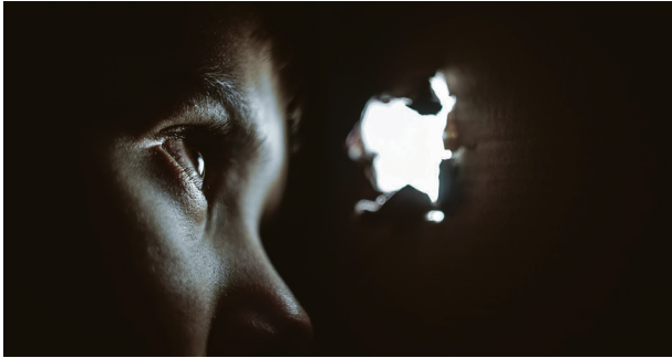
Fattigdom: Andelen barn som vokser opp i fattigdom øker.