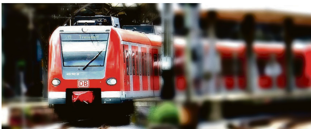
Jernbane: Rødt vil satse på klimavennlig transport.