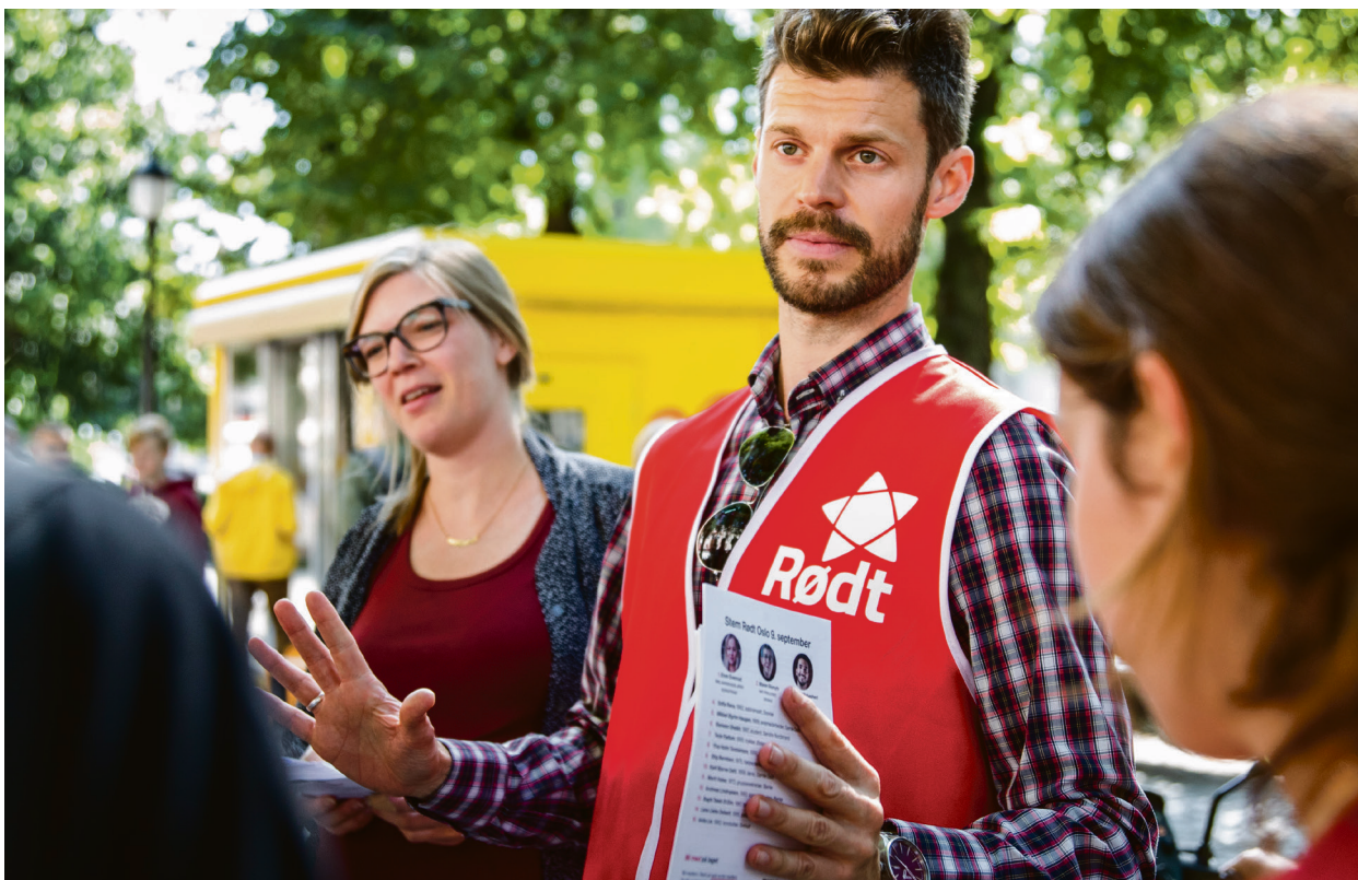
I valgkampmodus: Rødt-leder Bjørnar Moxnes.

som eies av oppkjøpsfond, aksjeselskap og storkonserner. Eierne av kjeder som Læringsverkstedet, Norlandia og Espira får milliarder i offentlige tilskudd og går med store overskudd. I tillegg til normalt utbytte blir verdier hentet ut gjennom å flytte penger mellom ulike selskap i et konsern. Disse pengestrømmen har vi liten kontroll med. Ved flere økonomiske tilsyn har vært avdekket juks for eksempel gjennom kunstig høye husleier til egne selskap.